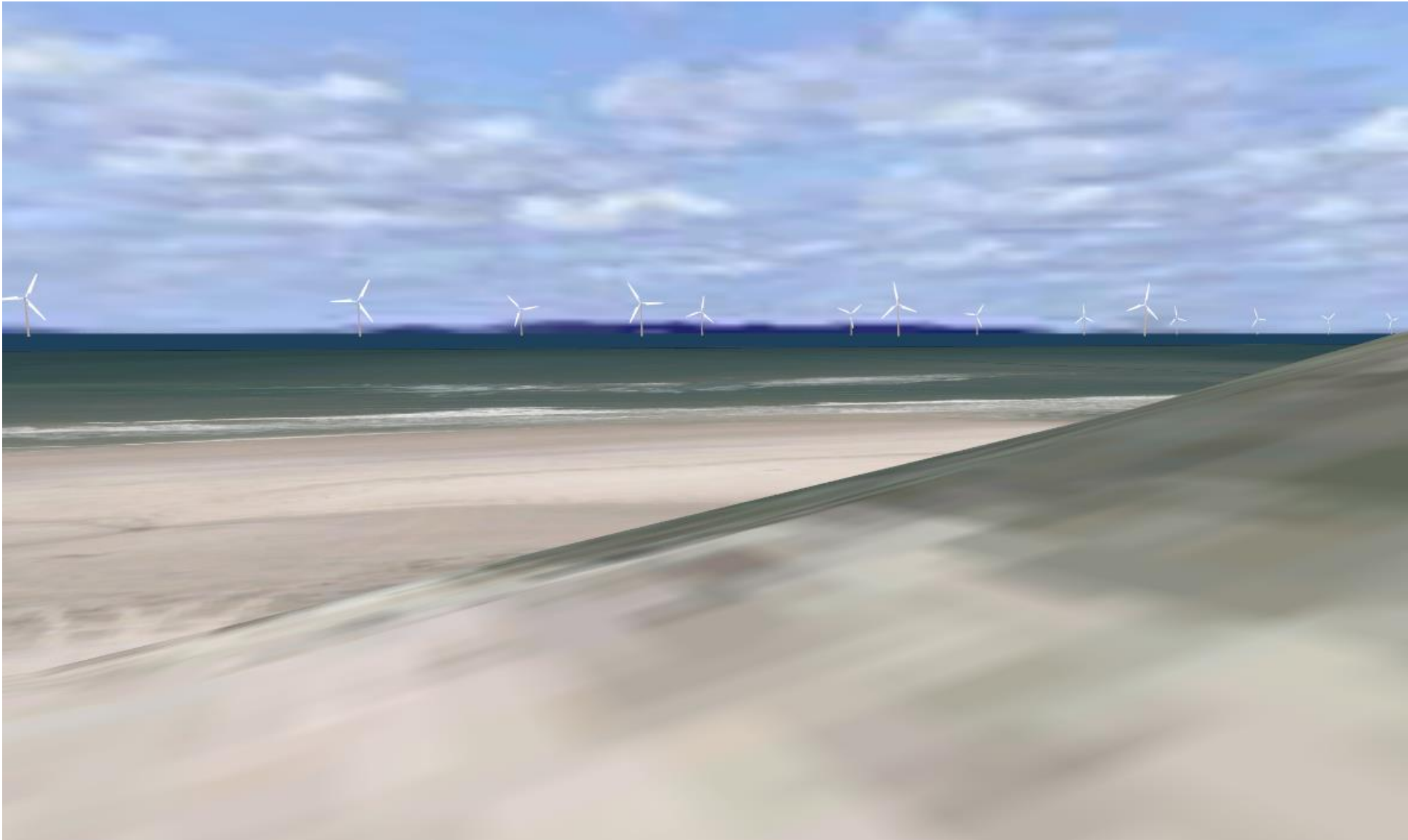
Møller set fra nedgangen til havet ved Sivbjerg Fyrmarken,